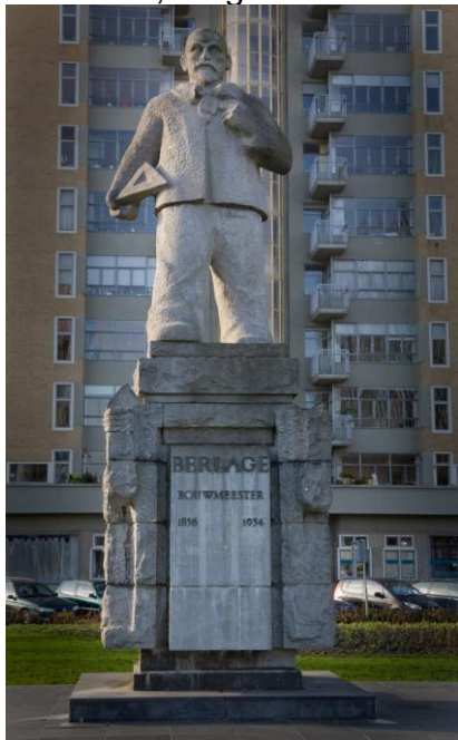
Beeld gemaakt door Hildo Krop van H.P. Berlage

Als stedenbouwkundige is Berlage vooral bekend vanwege het door hem ontworpen Plan Zuid, de grote uitbreiding van Amsterdam.