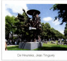
De Heureka, Jean Tinguely

De Zwitserse kunstenaar Jean Tinguely maakt bewegende kunstwerken (kinetische kunst). Zijn kunstwerk De Heureka was in 2011 te bewonderen aan de Apollolaan in Amsterdam, vlakbij het Hilton Hotel. Iedere eerste vijf minuten van een heel uur werd het kunstwerk in beweging gezet. Dan ging vrijwel ieder onderdeel van het kunstwerk bewegen, wat gepaard ging met veel gepiep en gekraak. Tinguely heeft dit kunstwerk ooit gemaakt voor de Wereldtentoonstelling in Lausanne in 1964, en staat in Zürich. Het kunstwerk is voor de tentoonstelling ARTZUID uit elkaar gehaald en getransporteerd naar Amsterdam. Het kunstwerk trok in 2011 dagelijks grote groepen mensen naar Amsterdam, die het kunstige werk kwamen bekijken en beluisteren.