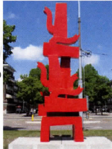
( http://kunstkieken.nl/wp-content/uploads/2015/05/IMG_9349.jpg )