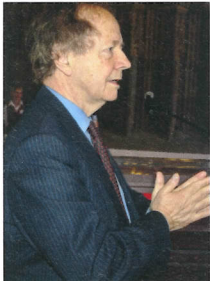
Prof. Werner Spies