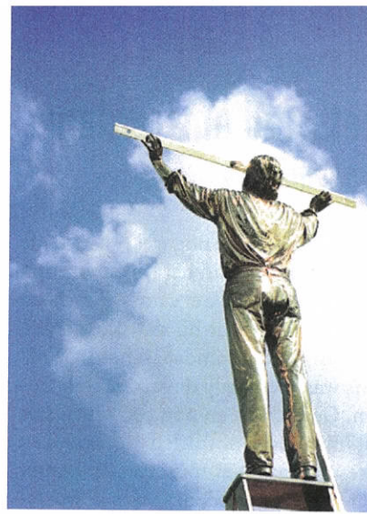
Jan Fabre: de man die de hemel meet

De inrichting van de groepstentoonstelling is geïnspireerd op 17e-eeuwse Italiaanse tuinen, met associaties van een labyrint vol vermaak.